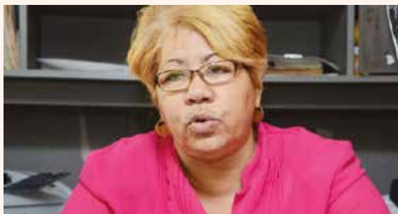
Por Ana Vertilia Cabrera

La Asociación de Comités de Amas de Casa Consumidoras y Usuarias de Servicios (ACACDISNA) externa su preocupación ante la cantidad de productos de consumo masivo que se producen y se comercializan sin reunir las condiciones mínimas que establecen las normas de la calidad y violando los artículos de las leyes que se refieren al etiquetado.